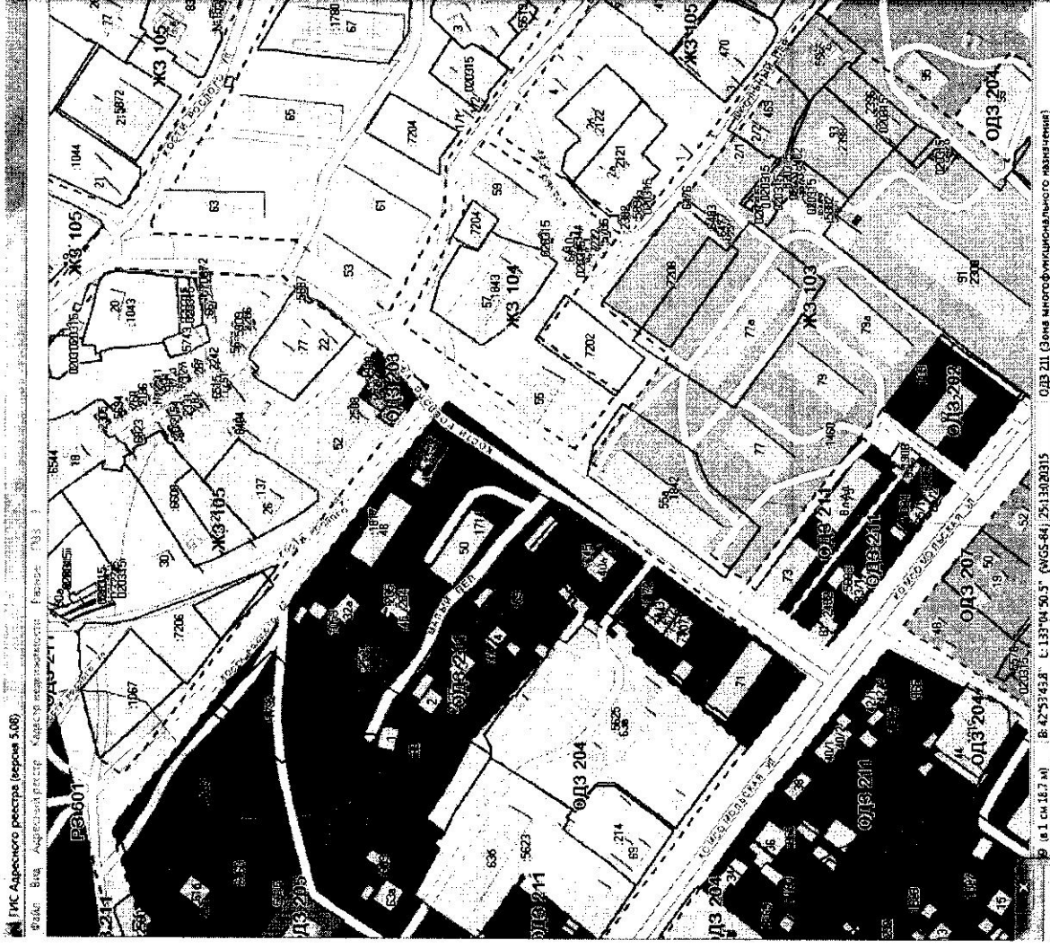
Зона ОДЗ 211 – зона многофункционального назначения