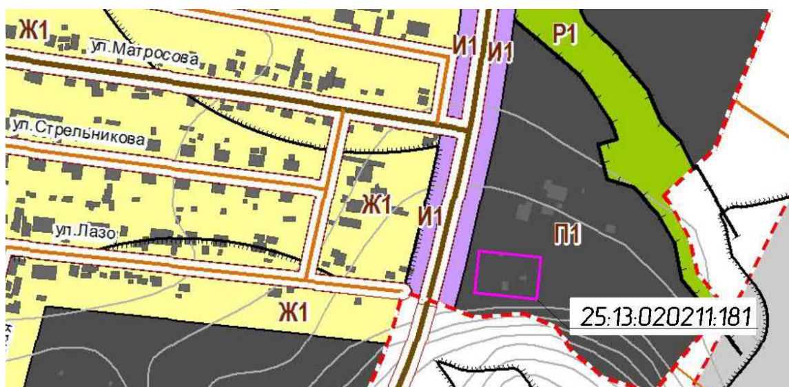
Схема размещения объекта на градостроительном зонировании территории, по которому планируется предоставление разрешения на условно разрешенный вид использования

Выписка из Правил землепользования и застройки Новицкого сельского поселения Партизанского муниципального района