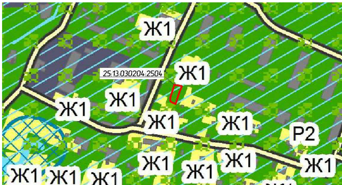
Схема размещения объекта на градостроительном зонировании территории, по которому планируется предоставление разрешения на условно разрешенный вид использования.

Установить условно разрешенный вид использования «для ведения личного подсобного хозяйства».